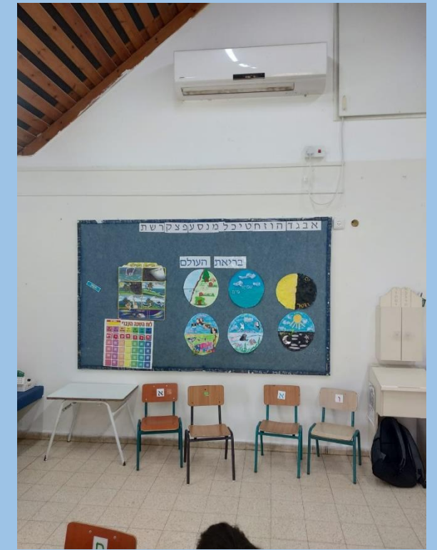
חלל גדול, סדנא מזמינה, מרכז הספר